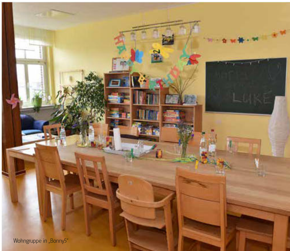
Wohngruppe in „Bonny5“