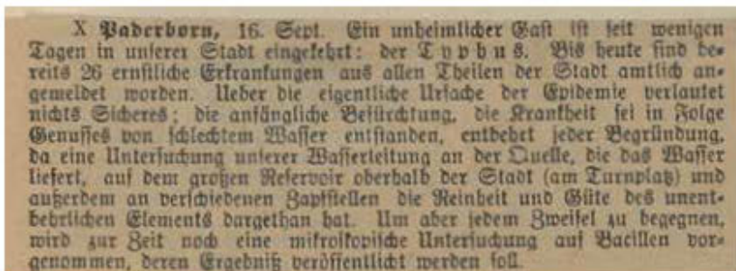
Zeitungsbericht aus dem Westfälischen Merkur vom 16. September 1893

Jeder Hausbesitzer solle „Senkgruben, Latrinen und Kloaken“ bis zum 16. des Monats „vollständig“ entleeren, „deren Inhalt aus der Stadt schaffen“ und „fern von allen öffentlichen Wegen und Plätzen unterbringen“.