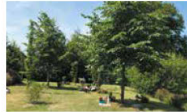
Vielfältige und individuelle Bestattungskultur auf den Paderborner Friedhöfen.