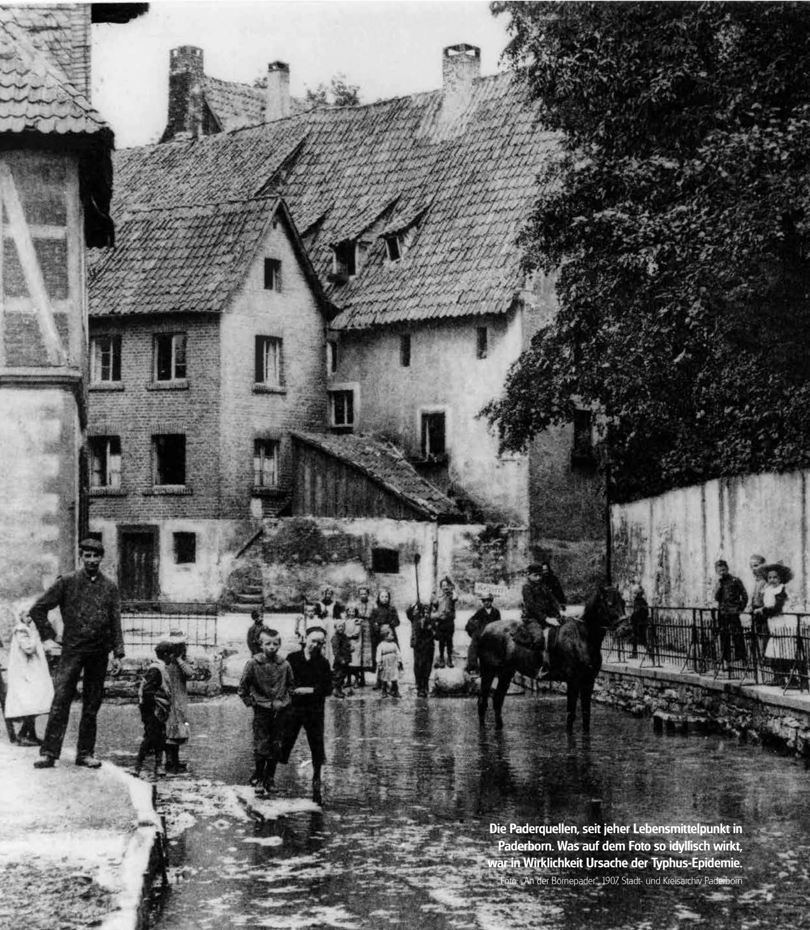
Die Paderquellen, seit jeher Lebensmittelpunkt in Paderborn. Was auf dem Foto so idyllisch wirkt, war in Wirklichkeit Ursache der Typhus-Epidemie.

Foto: „An der Börnepader“ 1907, Stadt- und Kreisarchiv Paderborn